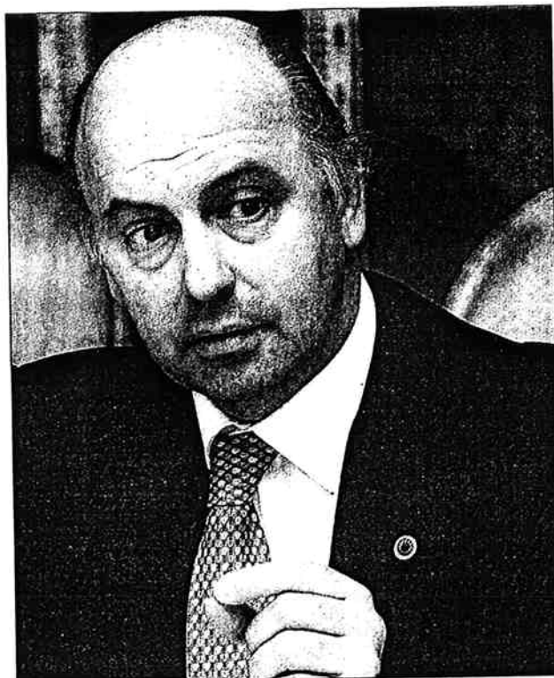
"Tengo dos personalidades: una como profesional financiero y otra como intelectual del mundo académico".