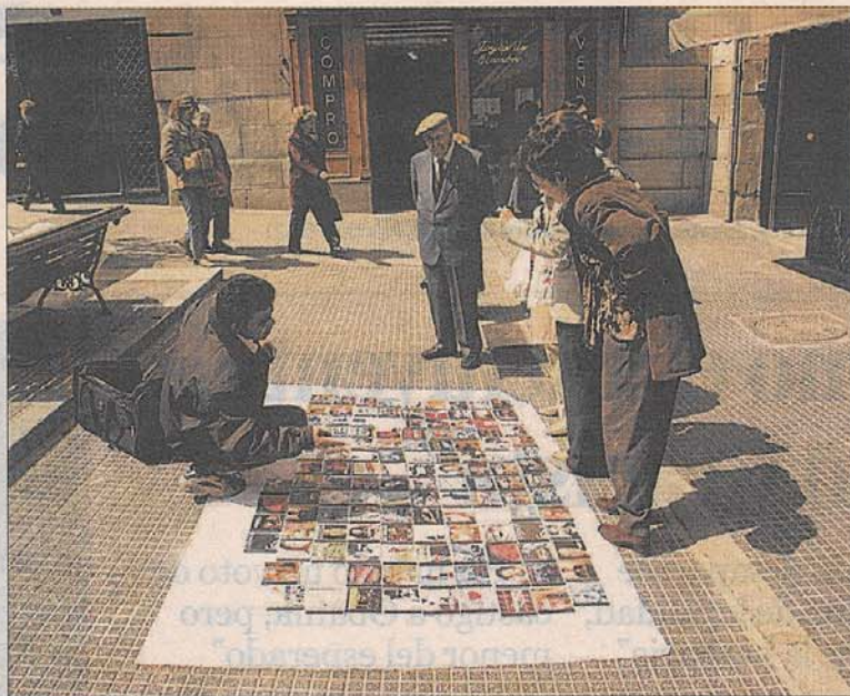
La piratería de contenidos culturales en España está generalizada.

Datos contundentes El estudio analiza la piratería de contenidos culturales de pago y ha utilizado, según sus responsables, "la muestra más elevada en un análisis de estas características en España". Los datos, como siempre en los informes sobre la piratería, arrojan cifras contundentes: la tasa de descargas pirata sobre el valor económico