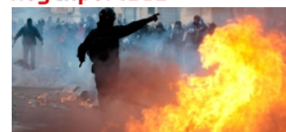
Mientras los estudiantes desatan su ira contra Berlusconi...