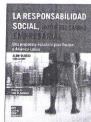
La responsabilidad social, motor del cambio empresarial. Autor: Aldo Olcese. Editorial: McGraw Hill. Precio: 26 euros

Este libro propone «ideas para la reflexión y soluciones para la acción válidas para directivos, empresarios y todos cuantos se relacionan con las empresas y sus Grupos de Interés».