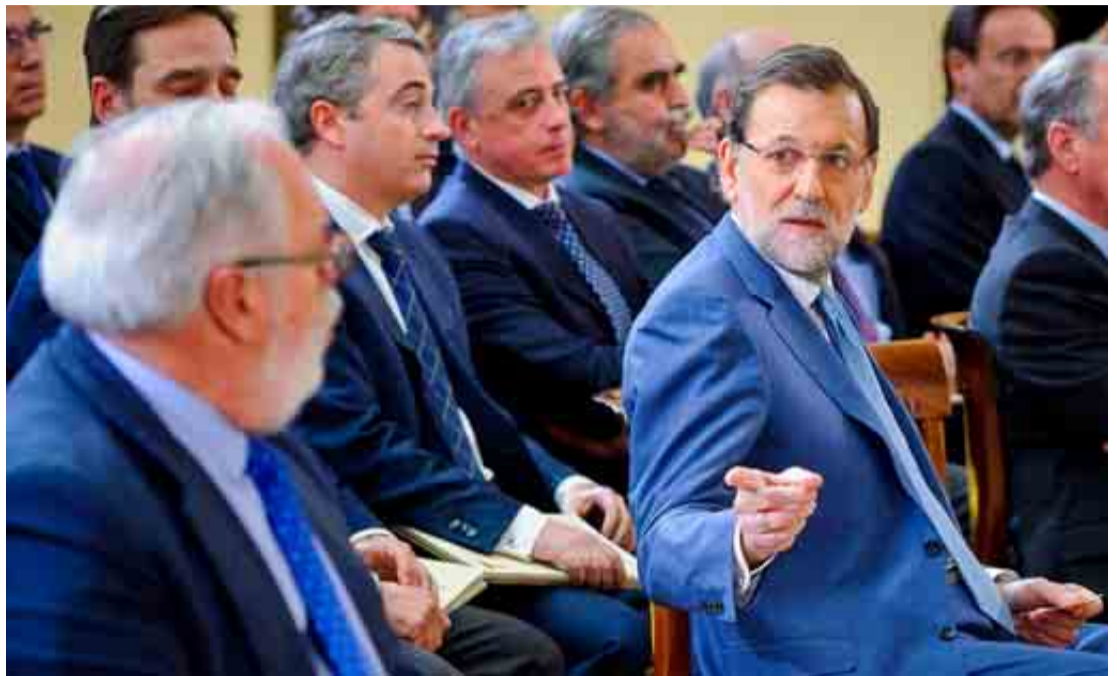
Mariano Rajoy se dirige a Miguel Arias Cañete durante un acto con empresas de alimentación.

El ministro de Agricultura intenta en sus últimos días enderezar la pérdida de españolidad de Deoleo tras la decisión de Bankia de entregarla a CVC. Un socio clave como Hojiblanca se rebela y la Sepi no comparte la estrategia de Cañete